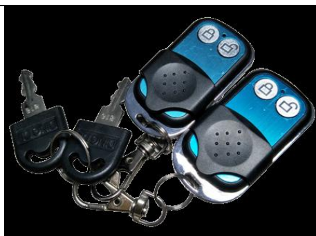
Пульт дистанционного управления + Ключ механический